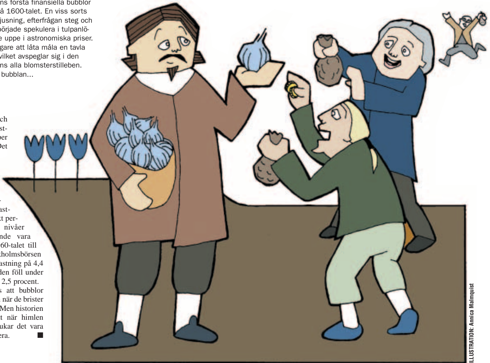
ILLUSTRATION: Annica Malmquist

Historien lär oss att bubblor kommer och går och när de brister gör det mycket ont. Men historien har också visat, att när himlen tycks ramla ned brukar det vara goda tider att investera. ■