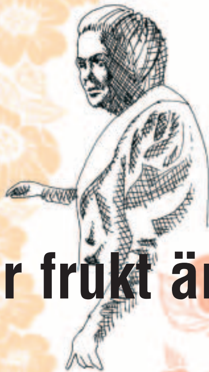
ILLUSTRATION: Jonathan Strömgren

(Källa: Nordisk familjebok – Uggleupplagan.)